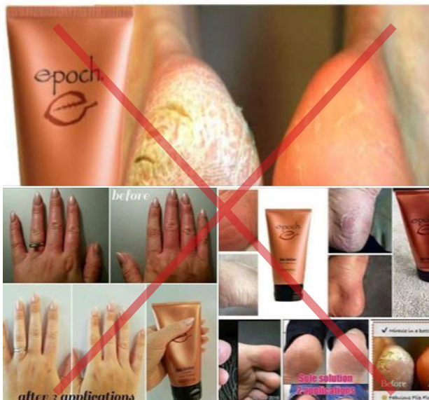
Výskyt neoprávnených tvrdení o produkte.