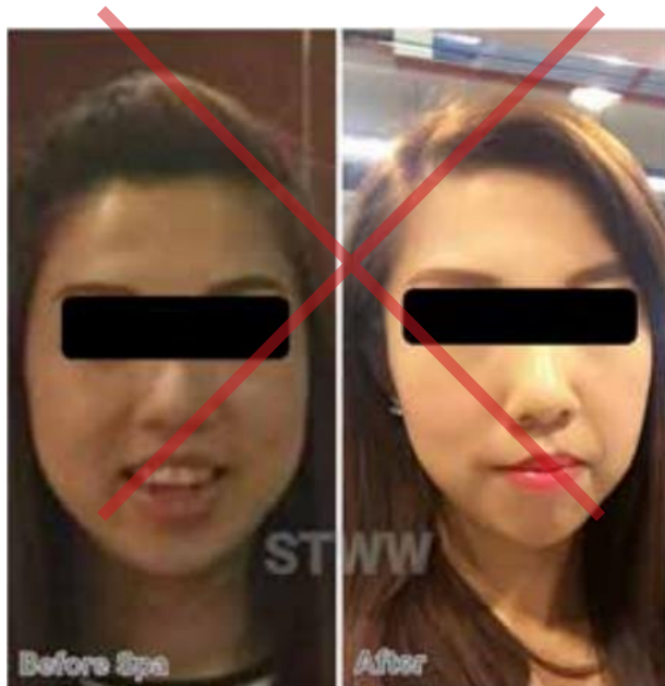
Fotografia je nejednotná. Osvetlenie, mejkap a uhol sú odlišné.