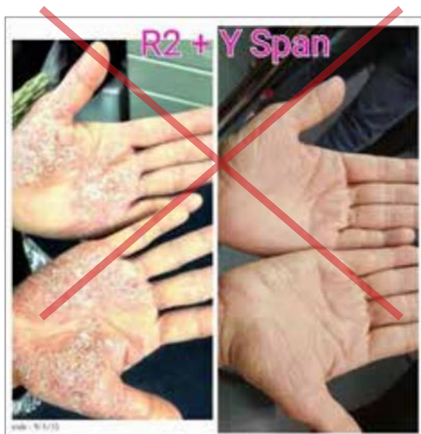
Zobrazenie neoprávnených zdravotných tvrdení a zdravotných stavov.