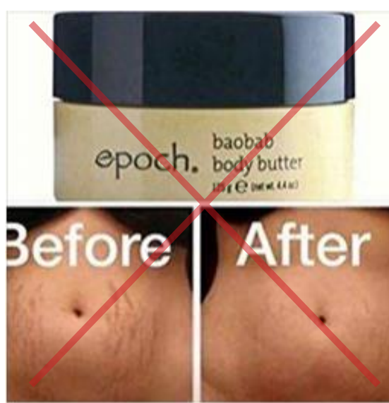
Výskyt neoprávnených tvrdení o produkte.